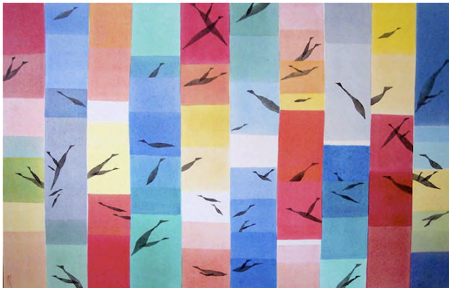
"Horizonte", 2005, Acryl/Lw, 90 x 140 cm