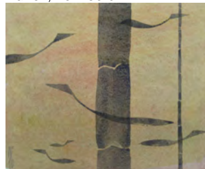
"Bambusfische", 2010, Acryl/ Bütten, 25 x 30 cm