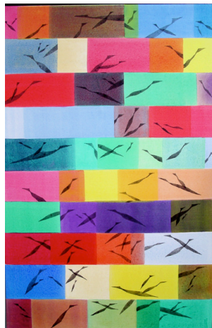
2005, "Lied der Fische", Acryl/Lw., 140 x 90 cm