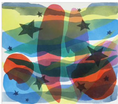
2013, "Schwarze Sterne", Acryl/Lw., 70 x 80 cm