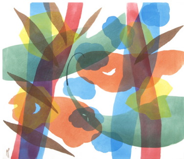
2016, "Maskenball", Acryl/Lw., 70 x 80 cm