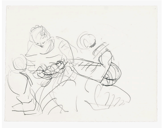
Skizze über Skizze v. Jacopo Palma, 2013, Bleistift, 38 x 49 cm

1985 Staatl. Akad. d. Bildenden Künste Stuttgart (Katalog) 1987 Kunsthalle Nürnberg (Katalog und Film) 1987 Städtische Galerie Altes Theater Ravensburg 1990 A11, Galerie Thomas, München