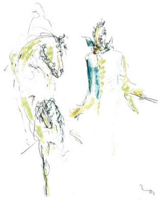
"Zirkus", 2014, DIN A2