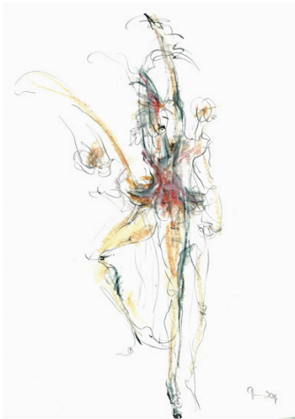
"Schwanensee", 2014, DIN A2