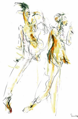
"Schwanensee", 2014, DIN A2